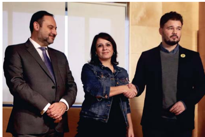
Algunos de los miembros de los equipos negociadores posan antes de la reunión.

Igualmente explica ERC que sus negociadores han trasladado a los socialistas “que la solución democrática para Cataluña pasa por una mesa de negociación que se fundamenta en cuatro pilares: Que sea entre gobiernos, sin apriorismos ni temas vetados, con calendario y con garantías de cumplimiento”. Y en el último punto de su nota el partido manifiesta que su posición respecto a “una eventual investidura” de Sánchez tras las conversaciones de hoy jueves