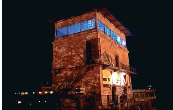
La actividad vuelve a la Torre Encendida, donde se ubica la radio autogestionada Radiópolis. NICO SALAS

Enero será el momento para disfrutar del concierto de la banda sevillana Rotod, el día 18 a las 20.00 horas. El día 25 es-