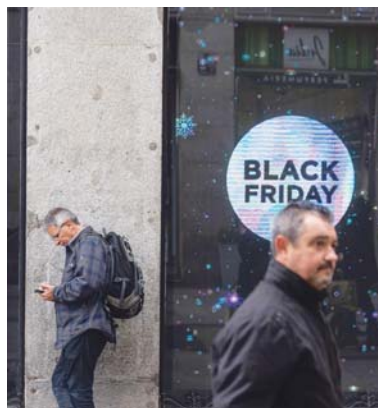
Un comercio relaciona la jornada con la Navidad.

El director de Retail de Oliver Wyman, Luis Baena, justifica el liderazgo del consumidor español en estos dos eventos por su renta per cápita, inferior a la de otros países europeos, que les impulsa a