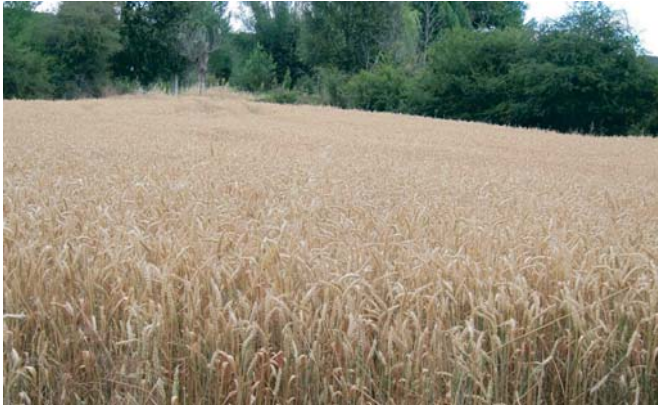
Europa pide más apoyos a los agricultores españoles, en especial a los andaluces. VIVA

La OMC autorizó en octubre a la Casa Blanca a imponer aranceles por valor de 7.500 millones de dólares (6.853 millones de euros) sobre las importaciones procedentes de la Unión Europea, lo que afectó especialmente a España, Francia, Alemania y Rei-