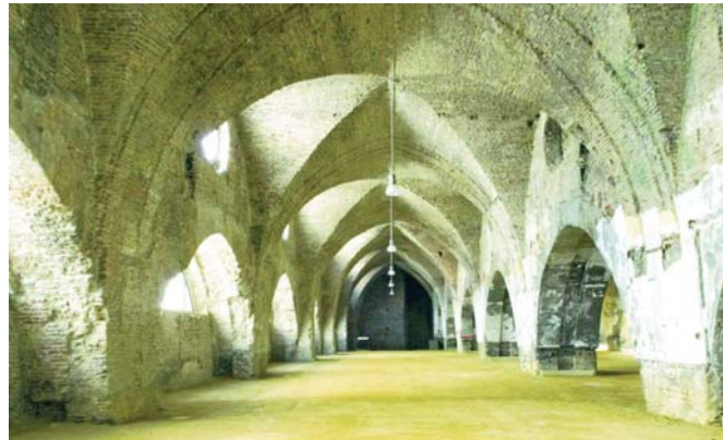
Interior de las Reales Atarazanas, que tendrían que albergar en 2020 un centro cultural.