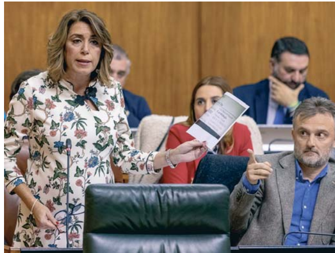
Susana Díaz, durante su intervención en el pleno celebrado ayer en el Parlamento andaluz.

Entonces, Moreno atacó la actitud de Díaz y le dijo que vivía en una “situación extremadamente compleja” y que estos días han debido ser para ella “un mal trago”. Sin embargo, el presidente andaluz le recordó que “está bajo el shock de una sentencia que